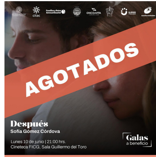
FESTIVAL INTERNACIONAL DE CINE DE GUADALAJARA