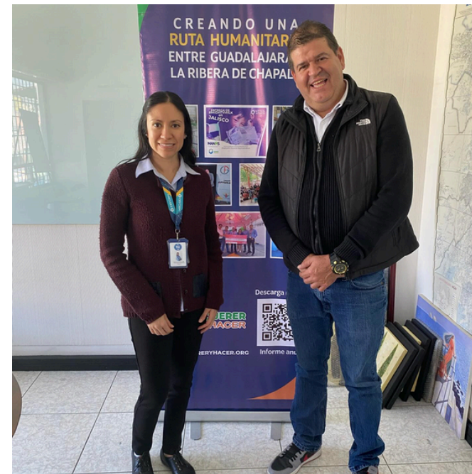
FUNDACIÓN STELLA VEGA