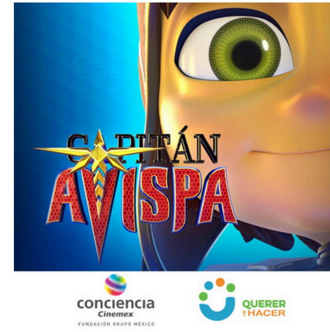
PREMIER A BENEFICIO