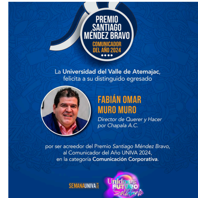
PREMIO UNIVA SANTIAGO MENDEZ BRAVO